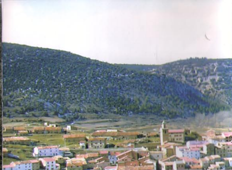
Vista panorámica de Royuela, con el Monte Carrascal al fondo