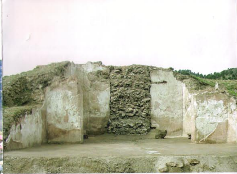
Ruinas del Monasterio de Nuestra Señora de los Dolores