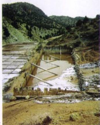
Salinas, en el paraje de El Valle

Pueblo enclavado en una colina dentro de la Sierra de Albarracín, pertenece a la histórica Comunidad. Rodeado de fértiles y alegres campos, transparentes aguas de ricos manantiales. A una altitud de 1214 metros sobre el nivel del mar. Dista 49 km de Teruel, próximo a Albarracín, Bronchales, Orihuela y Frías.