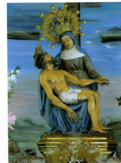
Ntra. Sra. de Los Dolores

Es el "Clavario" el que representa ese día la devoción a la Sma. Virgen.