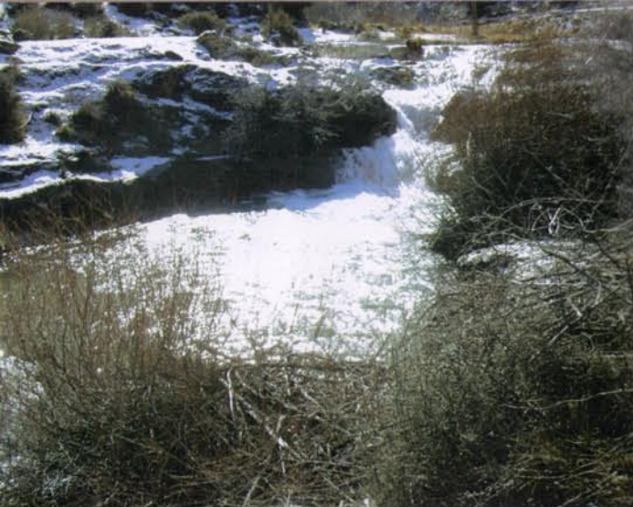
Los Ruideros, en el verano, piscina natural.